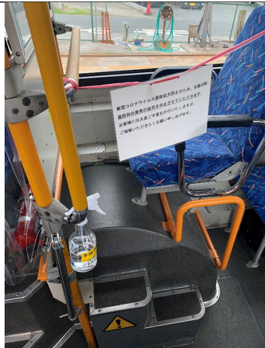
車内最前列座席の使用停止