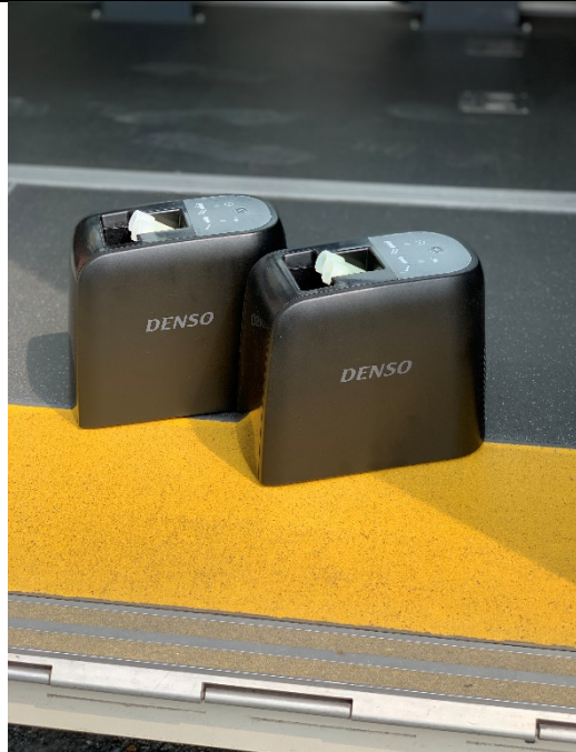
車両用クレベリン発生装置